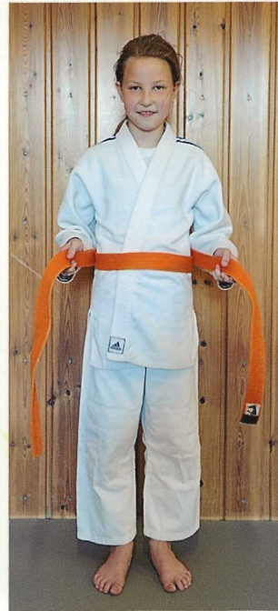
3. Gürtel kreuzen