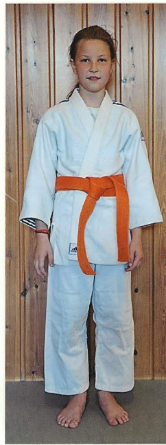
6. Wenn es so aussieht, hast Du alles richtig gemacht