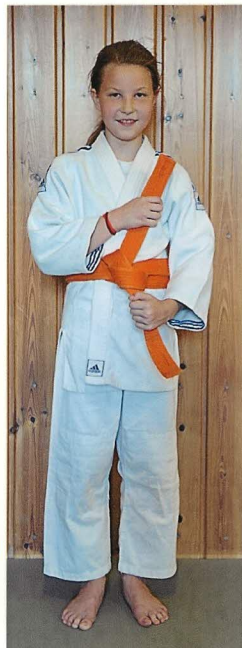
5. Verknoten und festziehen